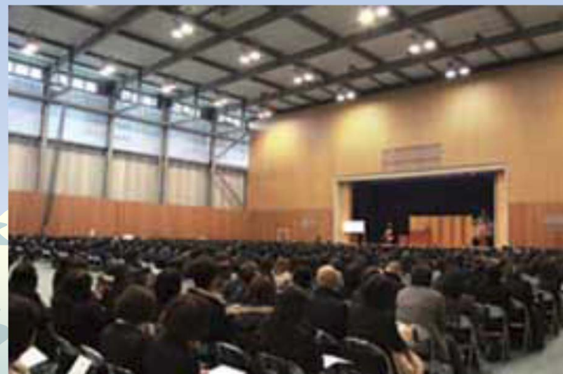
第一高等学校卒業式413人に祝福と激励