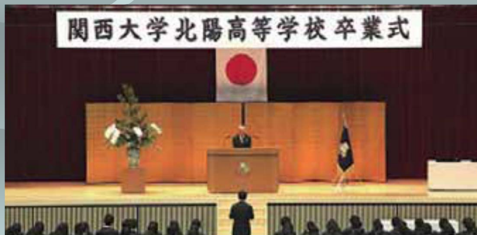
北陽高等学校卒業式4期生394人が旅立ち