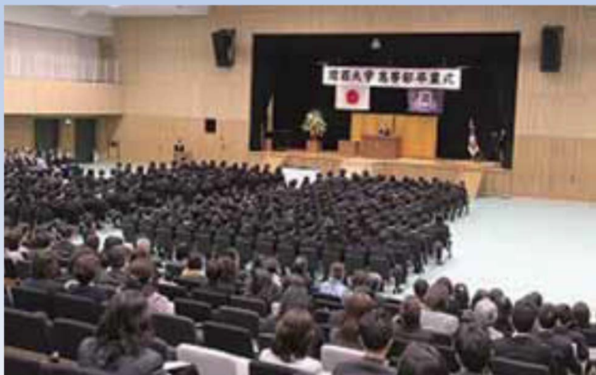
関西大学高等部卒業式2期生131人が巣立つ