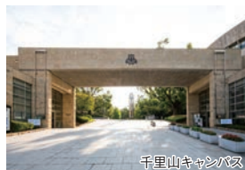
千里山キャンパス

法・文・経済・商・社会・政策創造・外国語・システム理工・ 環境都市工・化学生命工学部・大学院・専門職大学院 関西大学第一高等学校・中学校・幼稚園 〒564-8680 大阪府吹田市山手町 3-3-35 TEL 06-6368-1121 (大代表)