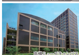
高槻ミューズキャンパス

社会安全学部・大学院 関西大学高等部・中部部・初等部 〒569-1098 大阪府高槻市白梅町 7-1 TEL 072-684-4000